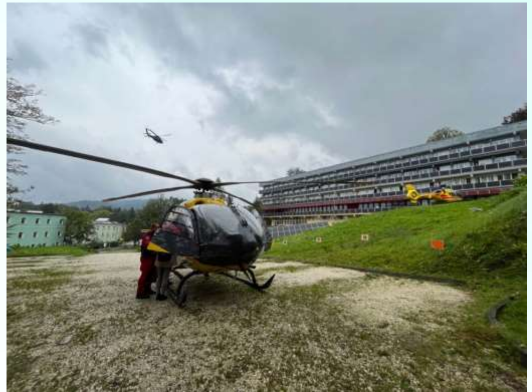
Na fotografii widoczne jest miejsce lądowania śmigłowców LPR – po prawej R23