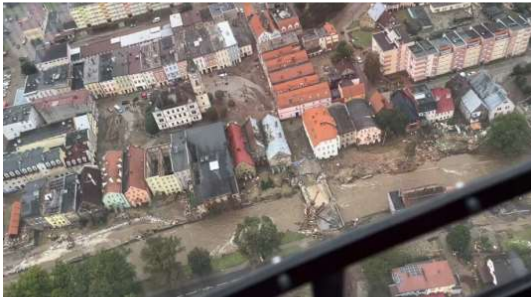
Zniszczone centrum Łódka-Zdroju sfotografowane w drodze do szpitala uzdrowiskowego